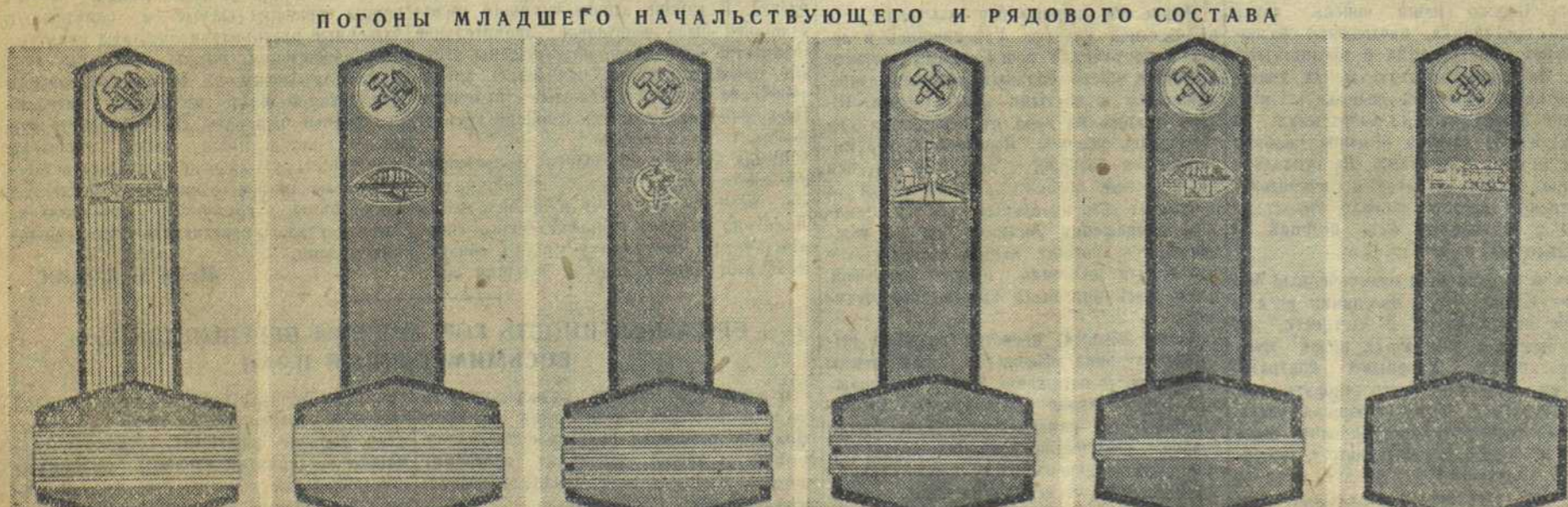
Техник тяги I ранга, Техник пути и строительства II ранга, Техник административной службы III ранга, Старший бригадный, Бригадный пути и строительства, Работник железнодорожного транспорта тяги.